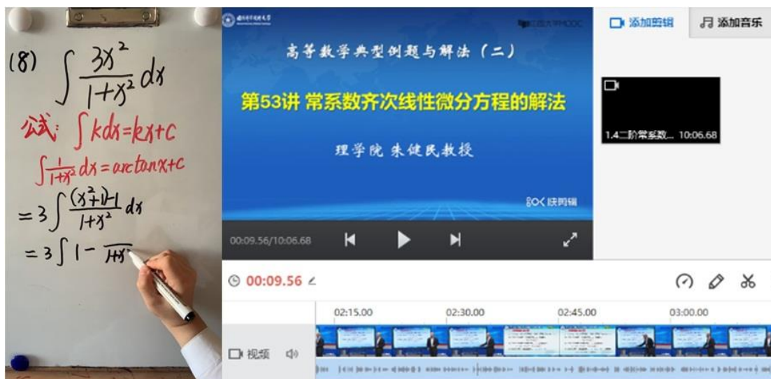
图 2：剪辑教学视频资源