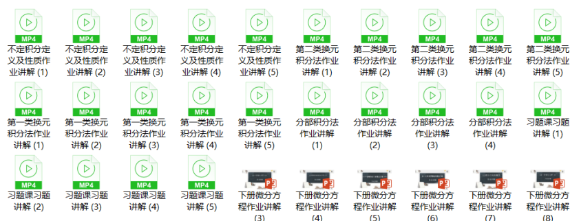
图 4：作业题讲解资料