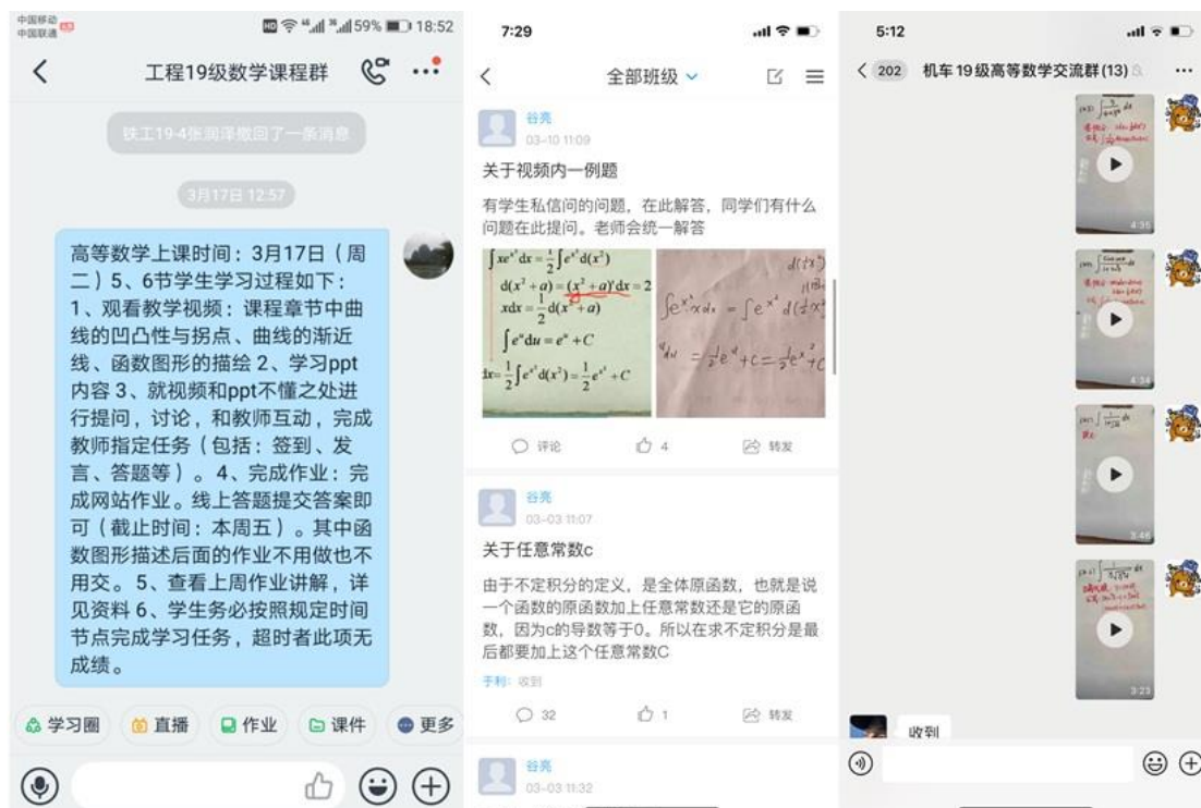
图 3：通过各类平台互动